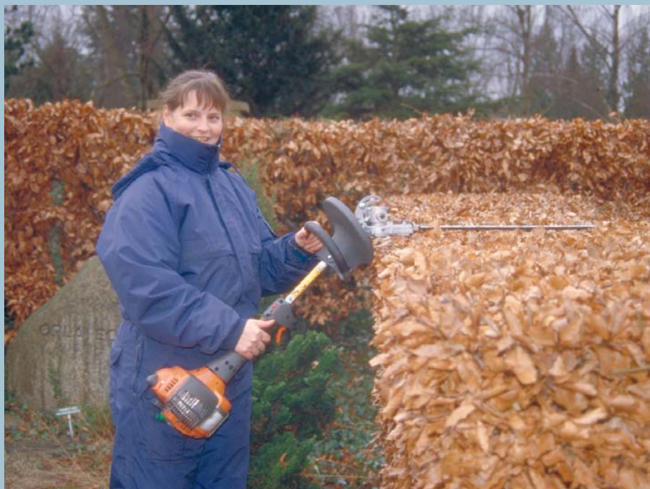
Klipning af toppen af hæk med stangklipper.