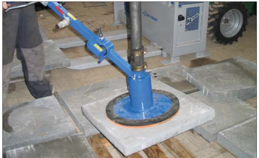
Før et maskinkøb bør der testes med en flise med et eller 2 stk. 6 mm huller i. Her en 50 x 50 x 5 cm flise med 2 stk. 6 mm huller.

Maskiner med vakuumpumpe vil typisk have et væsentligt højere luftflow end maskiner med en