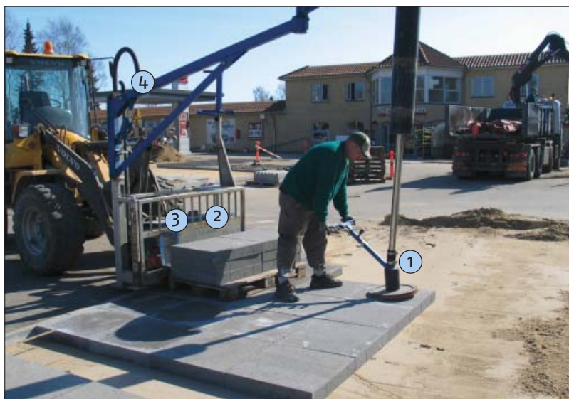
Vakuumløfteudstyret har flere dele der skal være fokus på: 1. Pakning ved mundstykke. 2. Luftfilter ved pumpe/turbine. 3. Pumpe/turbine, slitage. 4. Utætheder ved samlinger.

Endvidere vil der altid foregå en udfældning af kalk enten inde i stenen eller på overfladen, hvilket også er med til at tætte flisen.