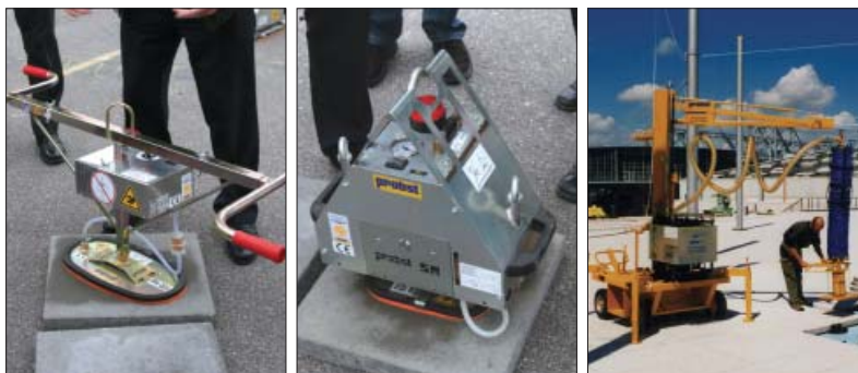
Yderst tv. en lille batteridrevet vakuumløfter. I midten en vakuumløfter der monteres på f.eks. en gravemaskine og drives af dennes hydraulik. Yderst th. en selvstændig vakuumløfter med stor luftflow. Det er kun de sidste to typer der kan være anvendelige til betonfliser.

Betonfliser er stort set altid støbt af jordfugtig beton (en meget tør be-