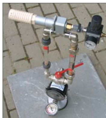
Udstyr til måling af porøsiteten af betonfliser.

Forsøgene viste desuden, at skumlæben der lægger an mod flisen, er et svagt punkt ved maskinerne. Er den stiv eller deform kan der ikke dannes vakuum. Ofte vil en opvridning af pakningen i varmt vand hjælpe.